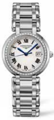
Longines (Hour Passion)

每周七天营业, 时间由 10:00 - 20:00, 节日期间 营业时间或有变动, 请查询网站。