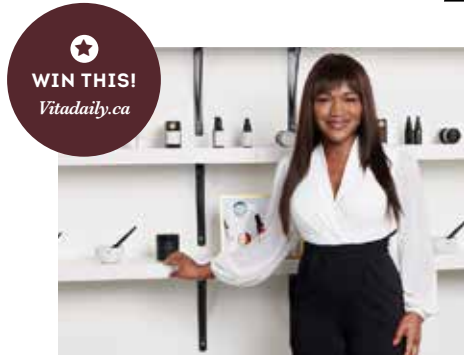
WIN THIS! Vitadaily.ca

溫哥華新店速報 VANCOUVER'S LATEST AND GREATEST RETAILERS