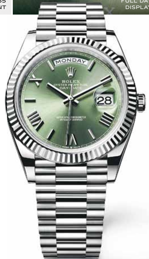
OYSTER PERPETUAL DAY-DATE 40 IN 18KT WHITE GOLD