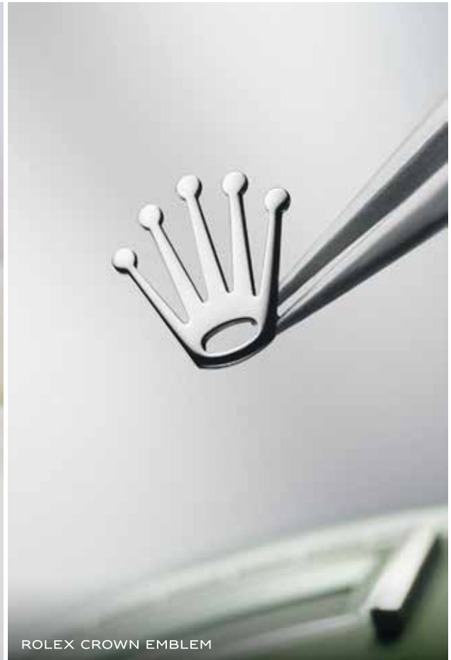
ROLEX CROWN EMBLEM